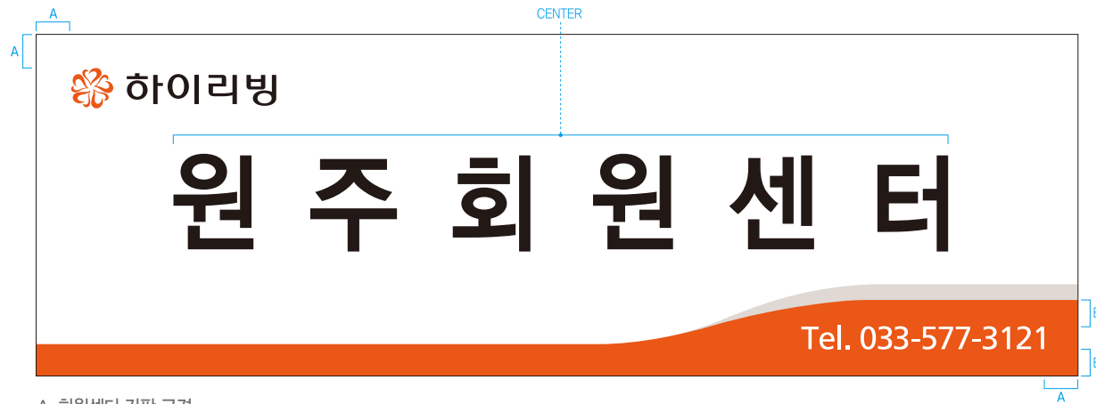
A. 회원센터 간판 규격

상단(좌측) : 하이리빙 규정 로고 · 중단(중앙) : 하이리빙 회원센터명 · 하단(우측) : 센터 운영회원이 추가로 기재하고자 하는 정보기재(연락처 등) 단, 회사로 오인할 수 있는 표현(로고, 상호, 주소 등) 사용이 불가함.